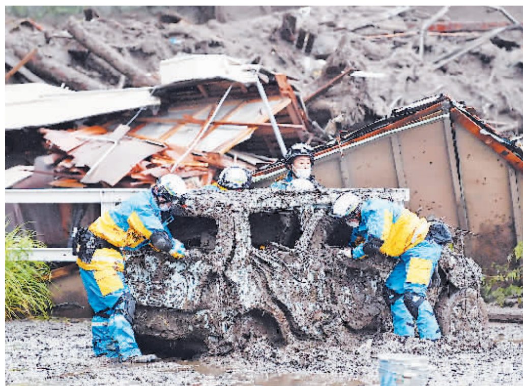
4日,救援人员在日本静冈县热海市的泥石流灾害现场查看一辆损毁的汽车。

据新华社电 日本静冈县热海市市长齐藤荣4日晚表示,该市在泥石流灾害中失踪的确切人数尚无法掌握,此前公布的20人下落不明只是泥石流灾害发生后的初步数据。