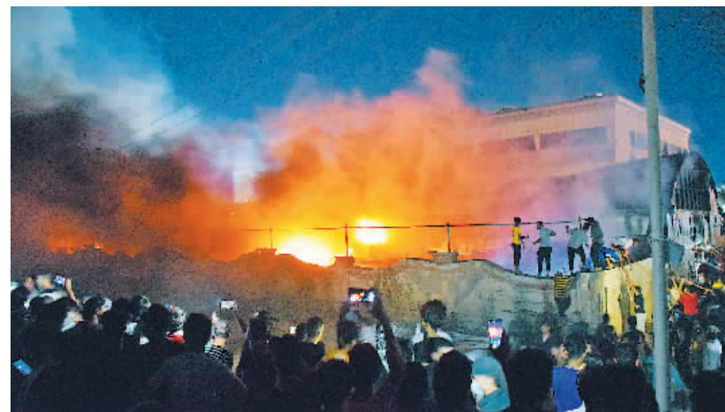
12日，人们聚集在伊拉克纳里耶的“侯赛因”医院火灾现场。

据伊拉克媒体13日报道，伊拉克南部纳里耶省一新新冠定点医院发生的严重火灾死亡人数已升至64人，另有50人受伤。伊拉克政府下令举行全国哀悼。