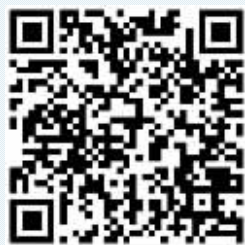
| 观看视频扫描二维码 |

作为新兴支付方式,数字人民币似乎和老年群体之间的联系不如年轻人紧密,不过,石景山打破了这一偏见。不仅老年人成了数字人民币支付的重要用户,也有越来越多的市民咨询并开始尝试大额充值消费。在分析人士看来,老年人能轻松使用,体现出数字人民币使用的便捷性,而“接地气”的使用场景,也将进一步加快数字人民币的后续普及和推广。