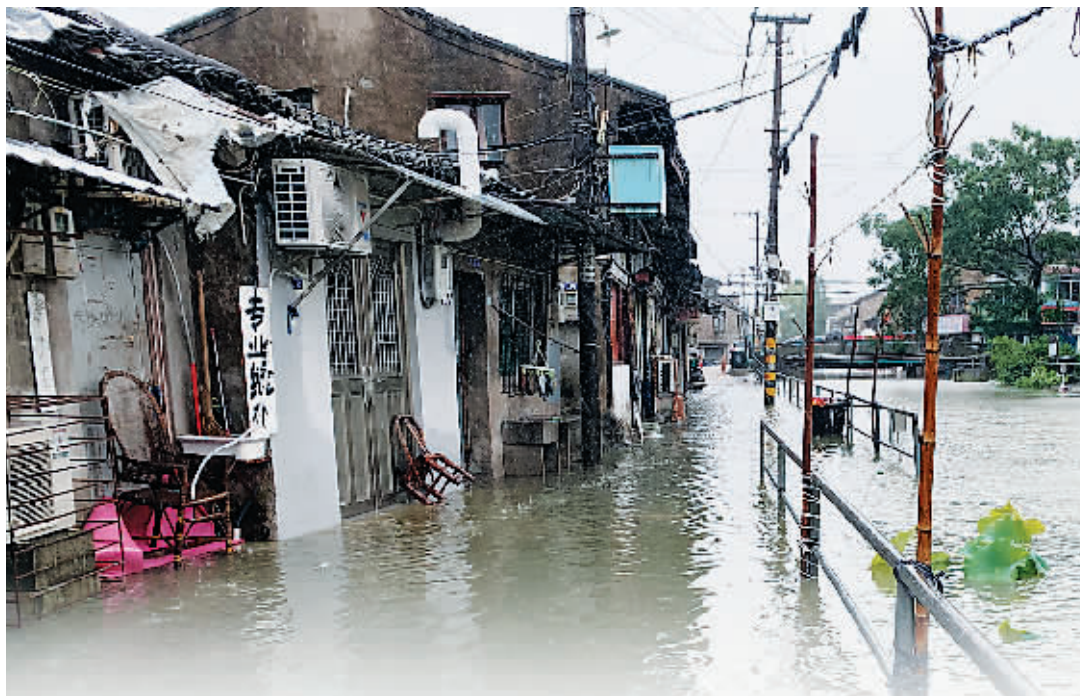
今年第6号台风“烟花”来袭。7月25日中午12:30前后,“烟花”在浙江省舟山普陀沿海登陆,登陆时中心附近最大风力13级(台风级38米/秒)。预计25日晚上至26日凌晨在浙江平湖到上海浦东一带沿海登陆(台风级,12级,33-35米/秒)。北京商报记者连线台风“中心地带”,带来一手现场消息。

7月25日8-14时,江苏东南部、上海、浙江中北部、安徽东南部等地区出现中到大雨,浙江宁波、绍兴、杭州、湖州出现暴雨,宁波余姚、湖州安吉等局地大暴雨