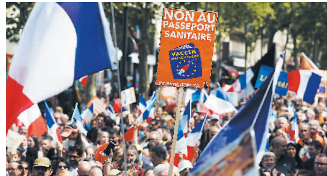
7月31日，法国巴黎，有接近1.5万人走上街头抗议健康通行证。

巴黎“乱”了。据今日俄罗斯（RT）报道，当地时间7月31日，数万人走上法国多个城市街头，抗议政府在抗击第四波新冠疫情时推出健康通行证的做法。但在巴黎，大规模抗议活动演变成了示威者与警察之间的激烈冲突，有3名警察受伤。