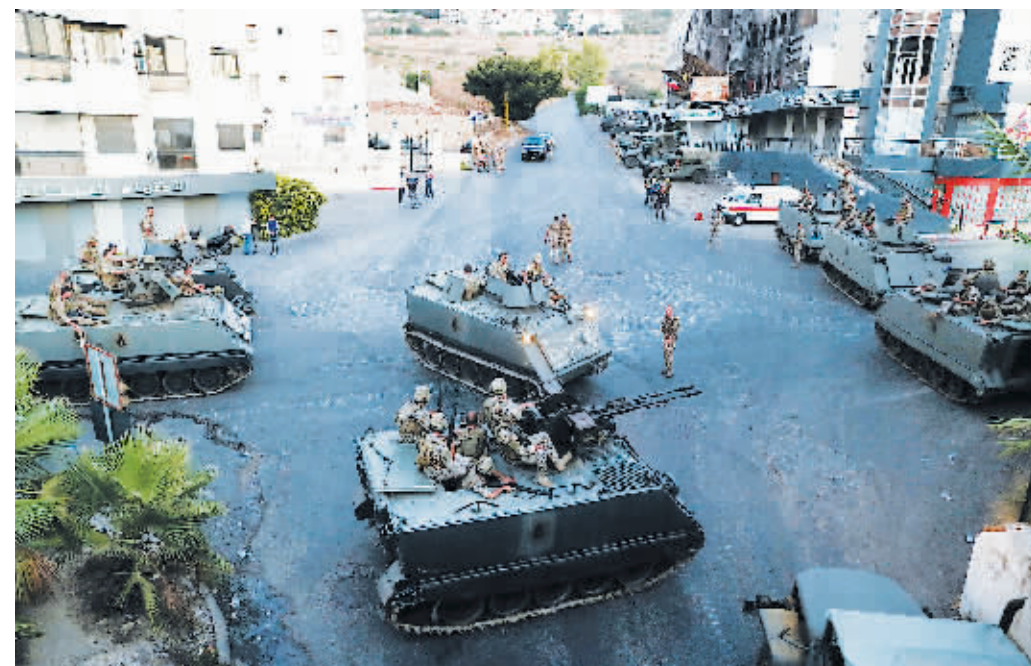
8月1日，黎巴嫩军队加强在贝鲁特南部海勒代镇的兵力部署。

黎巴嫩首都贝鲁特南部一滨海小镇8月1日发生武装冲突，造成至少5人死亡，10多人受伤。目前，黎巴嫩军队已加强在海勒代地区的兵力部署。