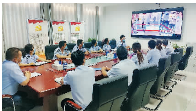
新疆维吾尔自治区联学画面