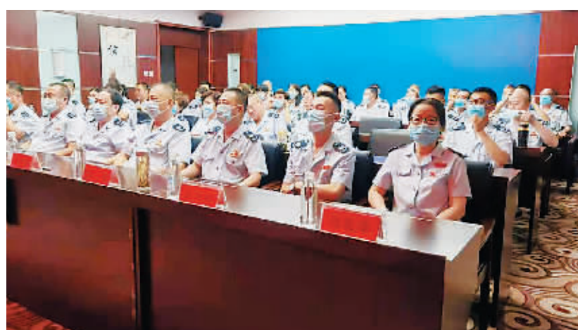
黑龙江省联学画面

北京市朝阳区税务局将积极响应“用好红色资源”赓续精神血脉，凝聚创新合力“不断创新税务党建工作模式，全面推进税务现代化建设高质量发展”的号召，发挥合力，纵横贯通，积极开展多渠道、全方位、多角度的冬奥税收政策宣传工作，打造立体宣传模式，持续做好各项冬奥会税收服务工作。