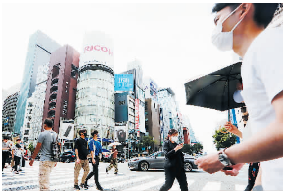
8月23日,戴口罩的行人走在日本街头。

当地时间24日,为了应对新冠肺炎疫情,日本政府基本拟定了在北海道和爱知县等八个地区启动紧急状态的方针,加上之前已启动紧急状态的东京都等地区,日本将有21个地区启动紧急状态。