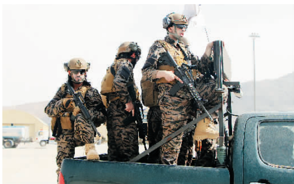
8月31日在阿富汗喀布尔机场拍摄的塔利班人员。