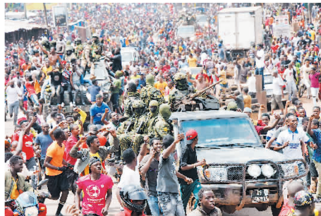
5日,人们聚集在几内亚首都科纳克里街头。

几内亚首都科纳克里5日上午枪声大作。科纳克里居民在接受新华社记者采访时说,枪声出现在总统府、国防部所在的卡卢姆区,持续约20分钟。