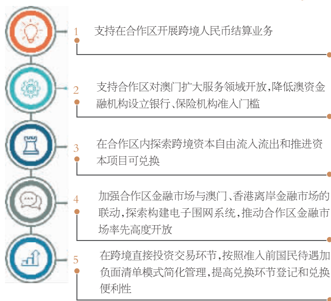
《横琴粤澳深度合作区建设总体方案》关于金融业要点