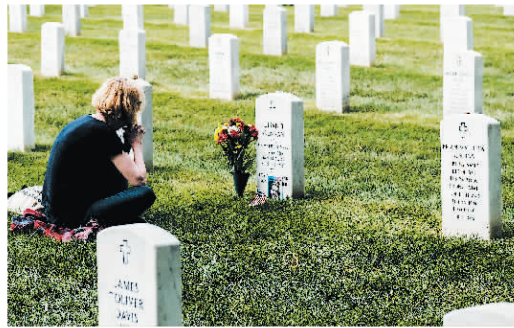
11日，一名女子在美国阿灵顿悼念在“9·11”恐怖袭击事件中遇难的亲人。

11日，美国华盛顿、纽约等地举行活动纪念“9·11”恐怖袭击事件20周年，以缅怀事件遇难者。