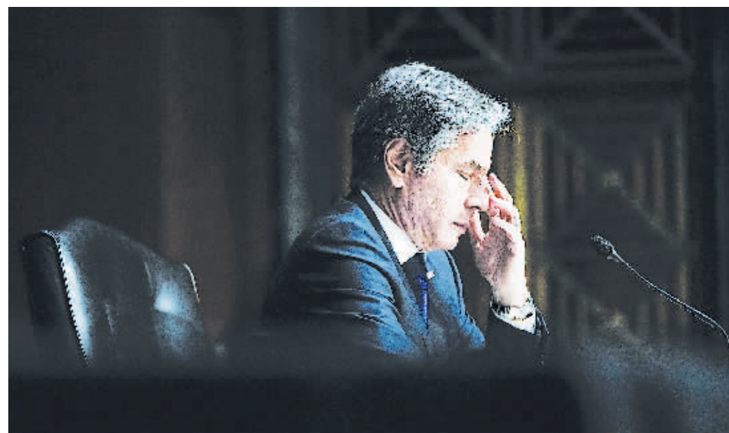
14日，美国国务卿布林肯在华盛顿出席国会听证会。

美国国会参议院外交关系委员会14日就美国从阿富汗撤离行动举行听证会，美国务卿布林肯出席并接受质询，为撤离行动进行辩护。