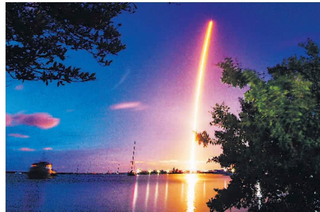
15日，在美国佛罗里达州肯尼迪航天中心，搭载4名“普通人”的美国太空探索技术公司“龙”飞船由“猎鹰9”号火箭发射升空。

美国太空探索技术公司（SpaceX）15日晚利用一枚“猎鹰9”火箭成功将“龙”飞船送上太空。飞船中的4名乘员为“全平民”组合，这个太空旅行团将绕地球飞行3天。