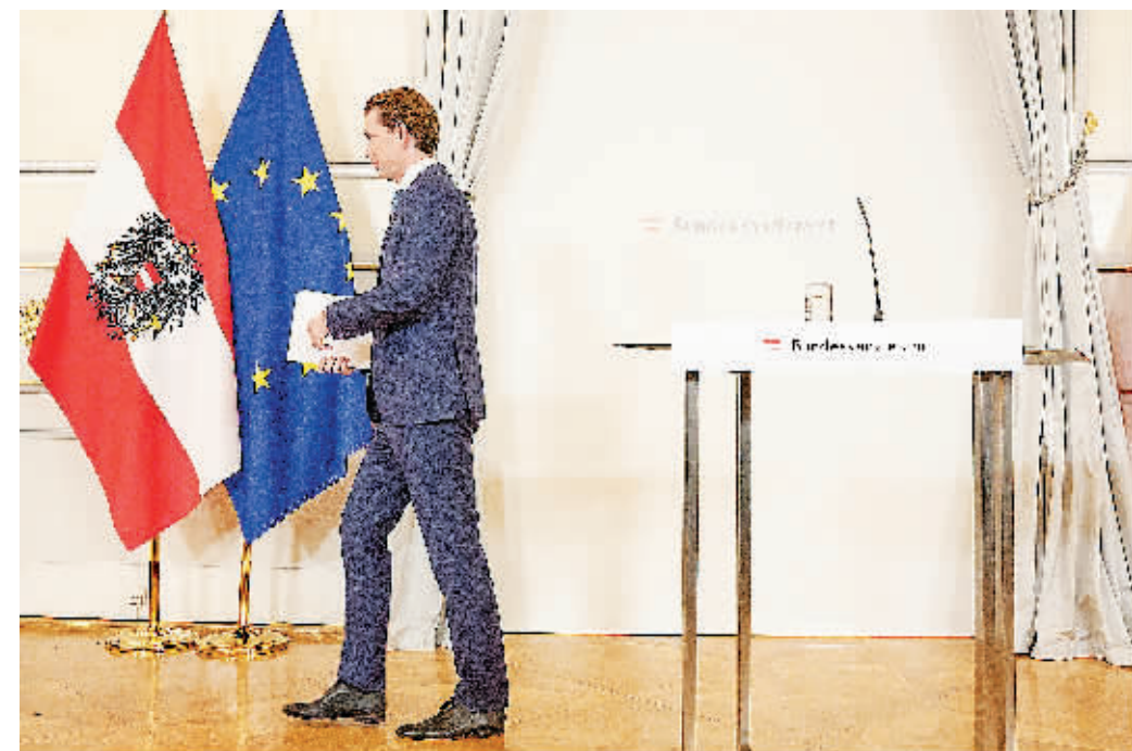
9日,奥地利总理库尔茨在维也纳出席记者会。