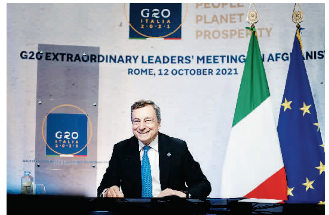
12日，意大利总理德拉吉在罗马主持二十国集团阿富汗问题领导人特别峰会。新华社图