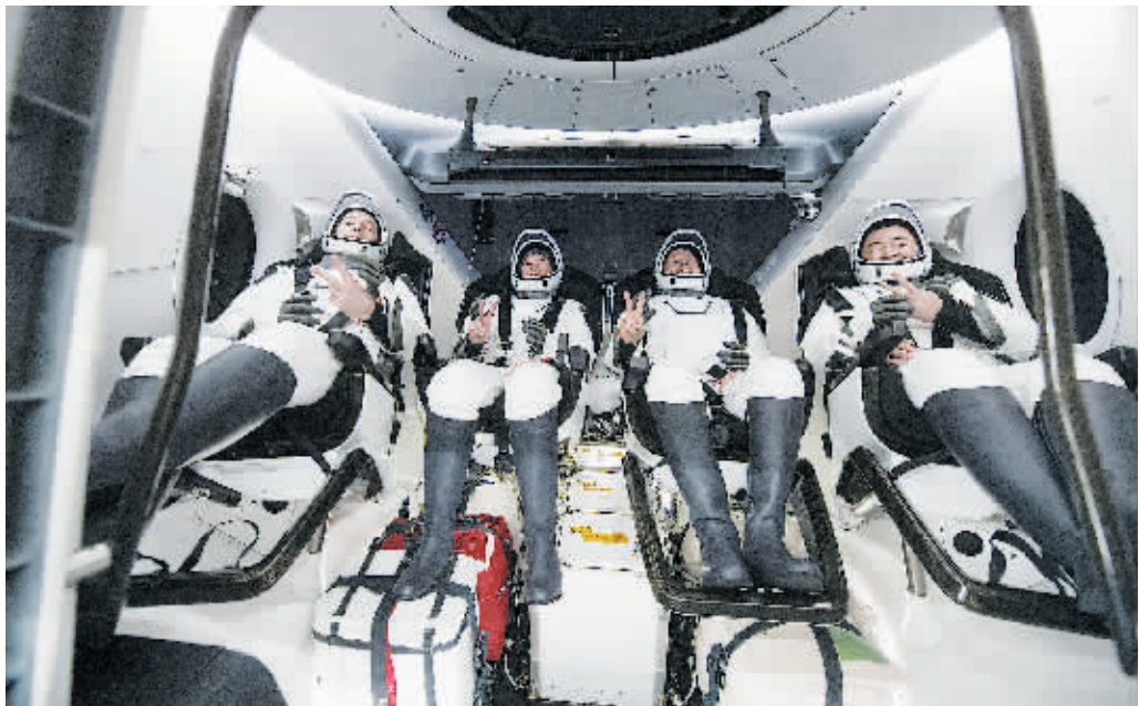
8日，SpaceX龙号太空舱载着四名宇航员降落在美国佛罗里达州。

当地时间2021年11月8日，SpaceX龙号太空舱载着四名宇航员，降落伞进入墨西哥湾，结束为期200天的空间站任务。