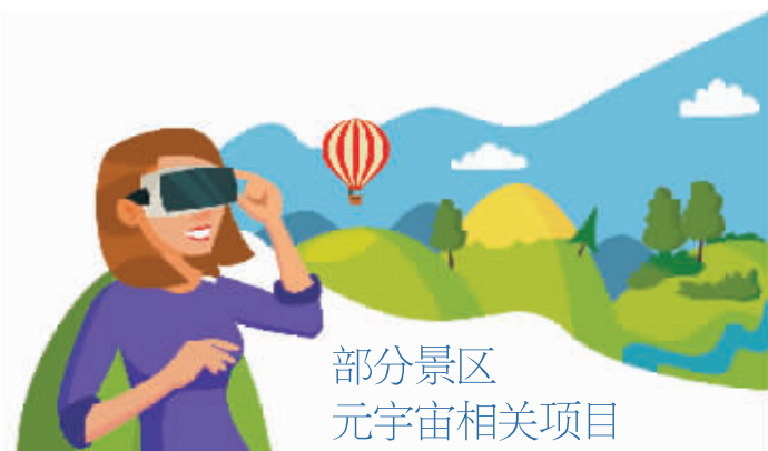
部分景区元宇宙相关项目

火出圈的元宇宙正逐步蔓延到旅游行业。11月21日,北京商报记者梳理发现,张家界、曲江文旅、海昌海洋公园等景区都在探索火爆的元宇宙概念。其中,张家界还成为全国首个设立元宇宙研究中心的景区。但是,在景区引入新科技的同时,第三季度的业绩也受到疫情影响。那么,“元宇宙”究竟是个噱头还是景区在技术加持下的转型新举措?在业内人士看来,对于元宇宙,景区还需继续探索,空有噱头肯定是不够的,未来还需要成果来应用,元宇宙能否给景区带来新的增长点,也需要时间来观察。