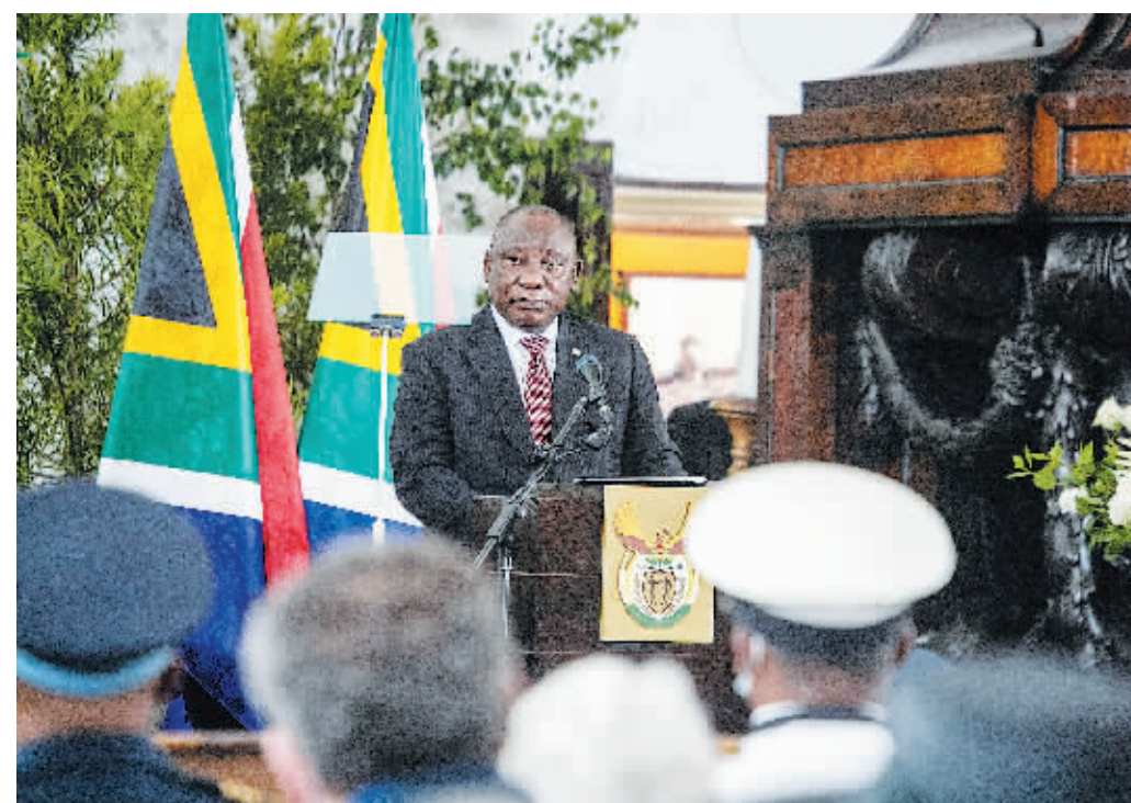
12日,在南非开普敦,南非总统拉马福萨在为前总统德克勒克举行的追悼仪式上讲话。

南非总统府12日晚发表声明说,南非总统拉马福萨当天新冠病毒检测结果呈阳性,正在接受治疗并进行自我隔离。