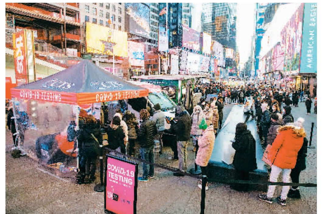
20日，人们在美国纽约时报广场排队等待进行核酸检测。

美国疾病控制和预防中心网站20日公布的疫情模型数据显示，截至12月18日的一周，变异新冠病毒奥密克戎毒株感染病例占到总病例数的73.2%。奥密克戎已取代德尔塔毒株成为在美主要流行毒株。