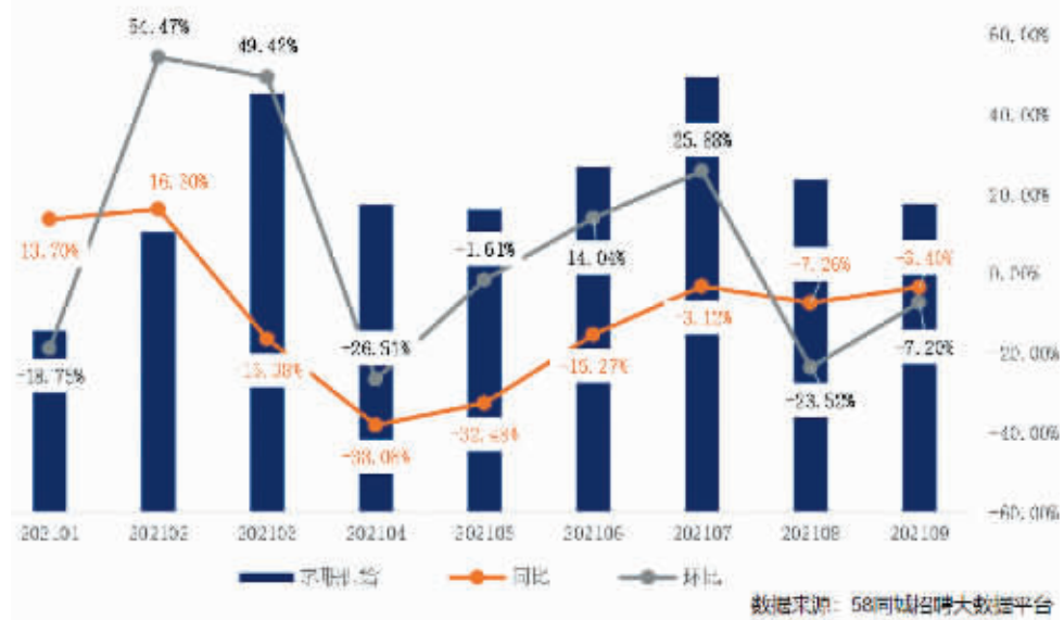
2021年前三季度各月全国求职供给及变化

作为国民招聘大平台，58同城依托丰富详实的大数据，对蓝领就业市场进行数据化统计梳理，从月份、供求、薪资等维度，对2021年招聘求职情况予以透彻分析，为招聘企业与求职者提供指南，也为政府部门与研究机构提供数据参考。未来，58同城将持续关注蓝领就业市场动态，及时分享招聘求职第一手资料，助力招聘行业健康有序发展。