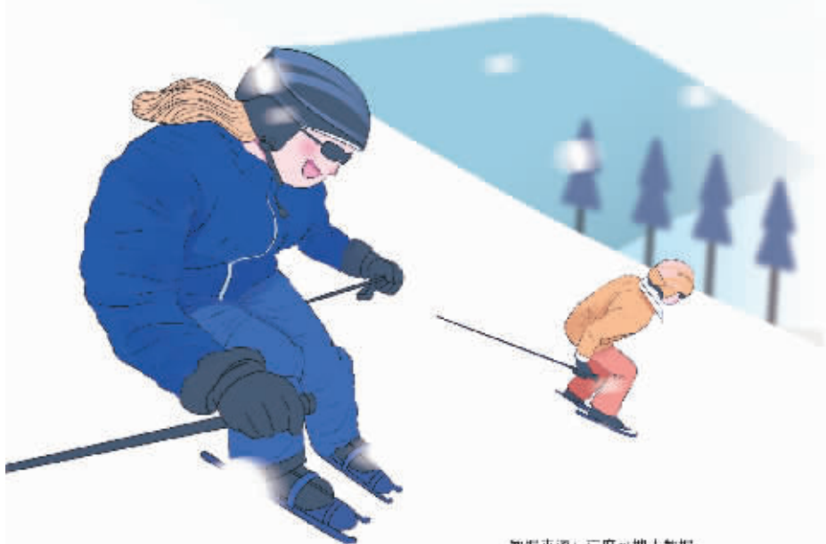
数据来源：百度热搜大数据