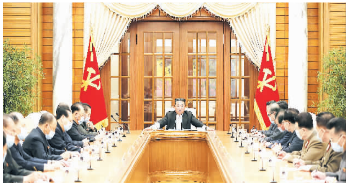
12日,朝鲜最高领导人金正恩出席朝鲜劳动党第八届中央委员会第八次政治局会议。会议称,朝鲜出现奥密克戎毒株亚型BA.2感染病例,决定将国家防疫体系转为最大紧急防疫体系。CFP/图

据朝中社12日报道,朝鲜国家紧急防疫部门本月8日对平壤一些有发烧症状的患者进行抽样检测后发现,有人感染了奥密克戎病毒。这是自新冠疫情在全球多地暴发以来,朝鲜首次报告在本土发现新冠确诊病例。