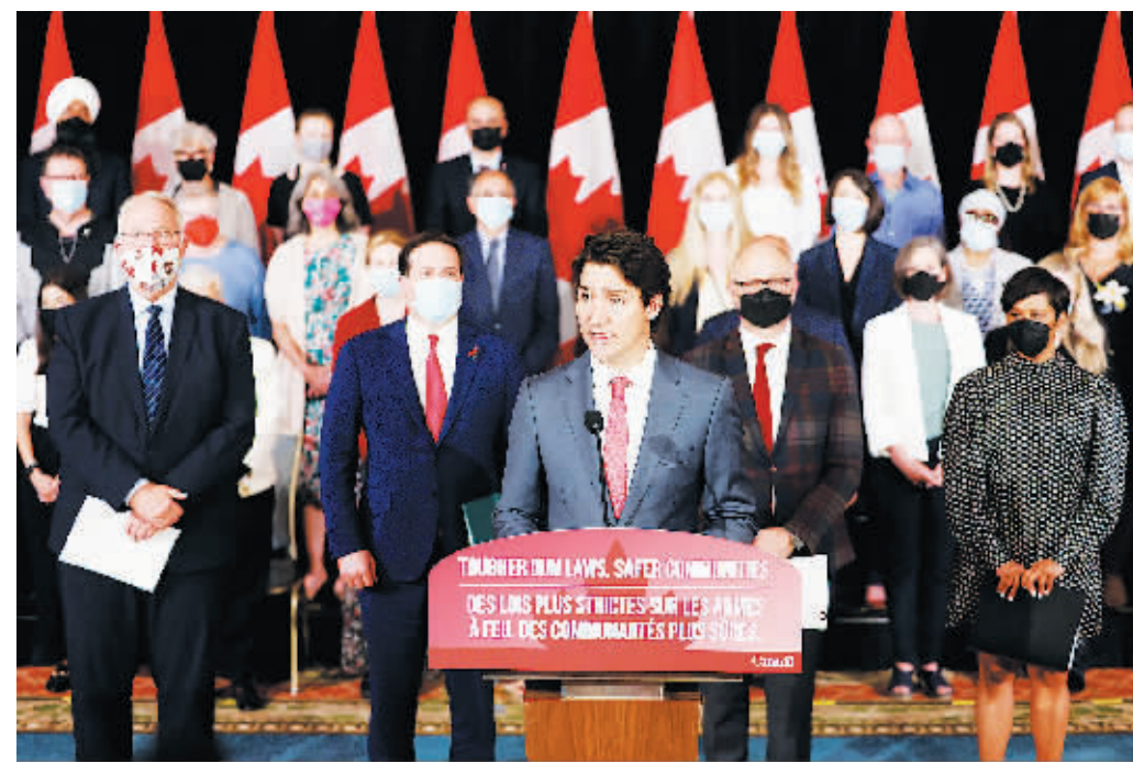
5月30日，加拿大总理特鲁多在渥太华举行的记者会上讲话。

加拿大总理贾斯廷·特鲁多5月30日宣布，政府将提出立法议案，冻结手枪买卖，旨在“限制国内手枪数量”。加拿大手枪数量近十年来激增，而美国近来发生的枪击惨案更刺激加拿大人神经，促使加政府收紧枪支管控。