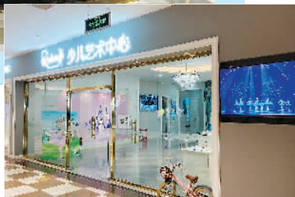
▶ 文化艺术类线下培训机构本周已陆续复课