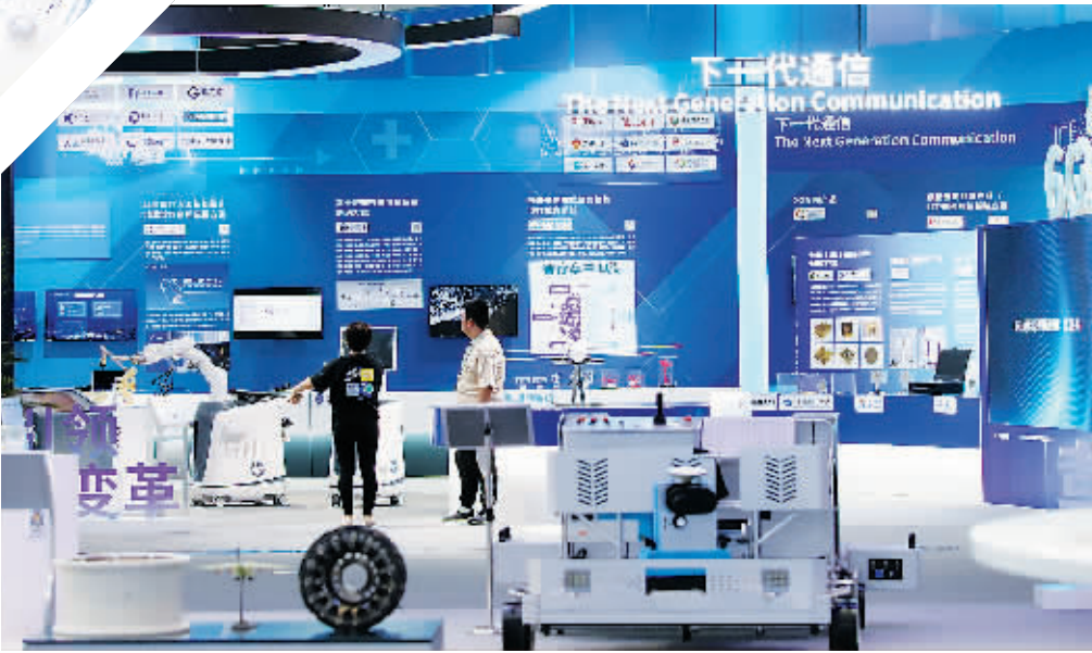
▲ 沉浸式、交互性成为突出的亮点之一，论坛全流程融入了多场景、高水平的科技产品应用。

本届论坛继续深入贯彻“科技办会”理念,突出智慧中关村论坛、绿色中关村论坛、云上中关村论坛三大方向。在现场,多点触控屏、裸眼3D屏、云智能刺绣机、智能服务机器人等前沿科技产品引人注目,为参会者带来极具沉浸感的体验。云智能刺绣机的智能刺绣系统能让传统工艺在日常生活中广泛运营,不仅引领了老字号的特色消费潮流,也用科技的力量助力传统手工艺传承。在机器人展区,既展示芯片、传感器等核心技术与零部件,也有应用于各行业领域的多功能机器人进行展览。希望通过中关村论坛,带大家看到更多美好生活新样态及未来发展新样貌。