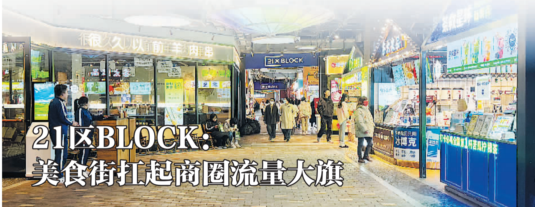
21区BLOCK迎来更多年轻消费者

餐饮板块如今在商场里的比重越来越大。坐标朝阳区,位于东三环和四环之间的北京朝阳合生汇是目前北京商业体餐饮商户数最多的商场,尤其集中在位于B1及B2的21区 BLOCK。也正是美食林立的餐饮街区,让越来越多年轻人涌入朝阳合生汇及大郊亭商圈。这样的现象不止于此,如今大部分商圈餐饮配套比例不断提升。回望过去,餐饮业态在商场里零星分布在某些角落,如今却成为商场的流量担当。不过,经历黑天鹅,商场和餐饮的联姻也出现了分岔口,有的品牌逃出商圈走进社区,有的品牌借此在商场跑马圈地,而这背后正是商场和餐饮之间的选择权在发生变化。