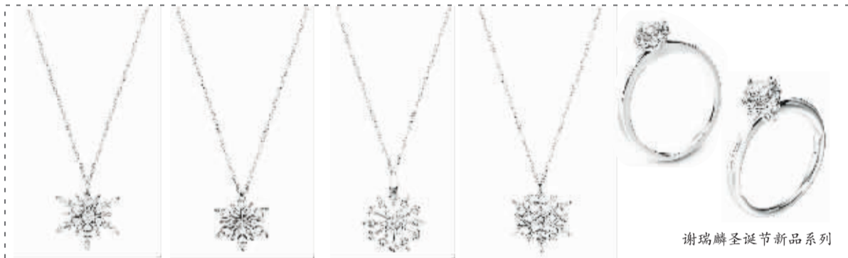
谢瑞麟圣诞节新品系列