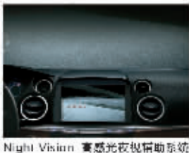
Night Vision+豪感光夜视辅助系统