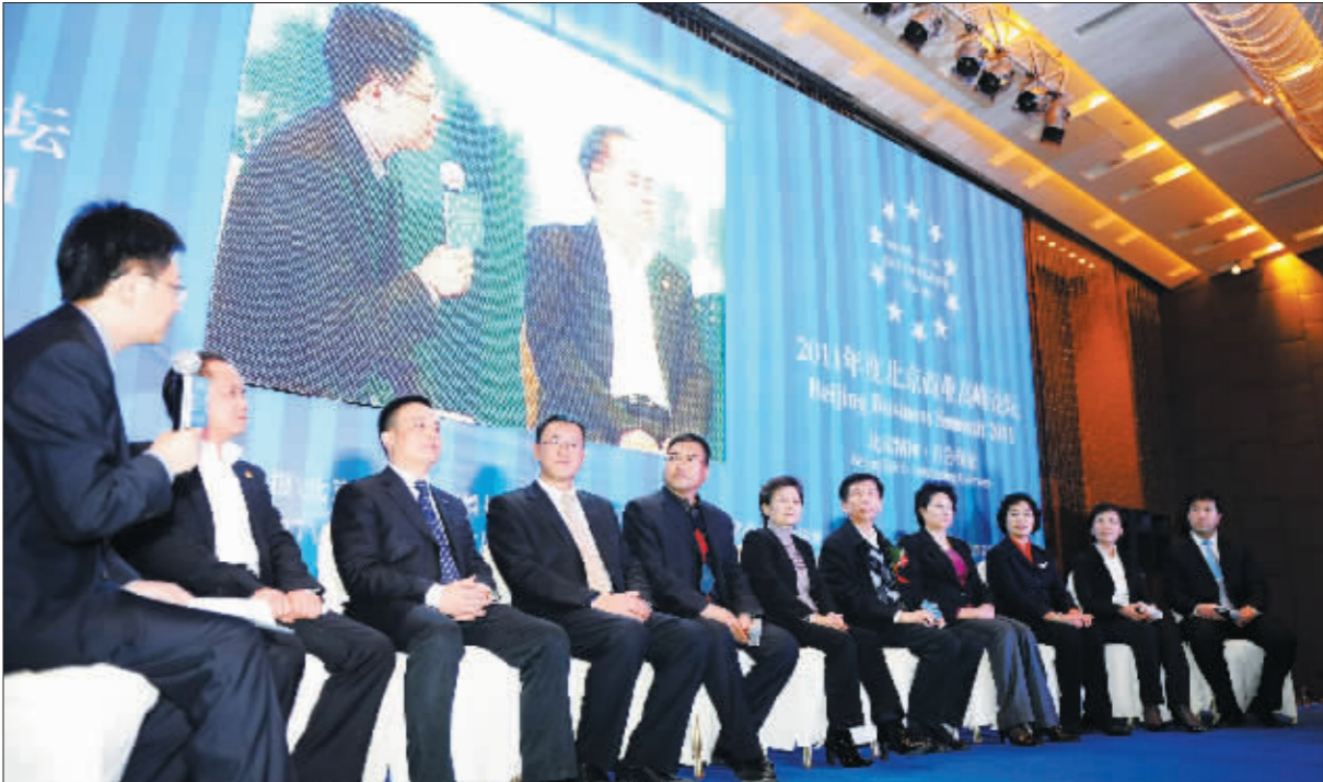
昨日,由北京市商业联合会和北京商报联合举办的“2011年度北京商业高峰论坛”在京举行,政府官员、商业专家与来自百货、超市、餐饮等13个商业业态的200余位精英共聚一堂,就“北京精神·首善商业”的核心议题展开研讨。这是自“北京精神”公布以来,首次分行业研讨“北京精神”的业内盛会。(详细报道见第5版)