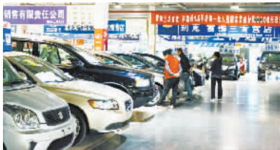
告别了连续两年的爆发式增长,2011年中国车市增速明显放缓。

对于中国车市而言,2011年可谓是跌宕起伏的一年。在经历了前两年高速增长之后,车市突然遇冷,增速回落,曾经一度让人担心今年中国汽车市场会出现负增长。然而,伴随着车市进入收官阶段,中国汽车市场并未让人失望。根据中国汽车工业协会(以下简称“中汽协”)的预测,今年中国汽车市场保持正增长已无悬念,增幅预计在2%左右。