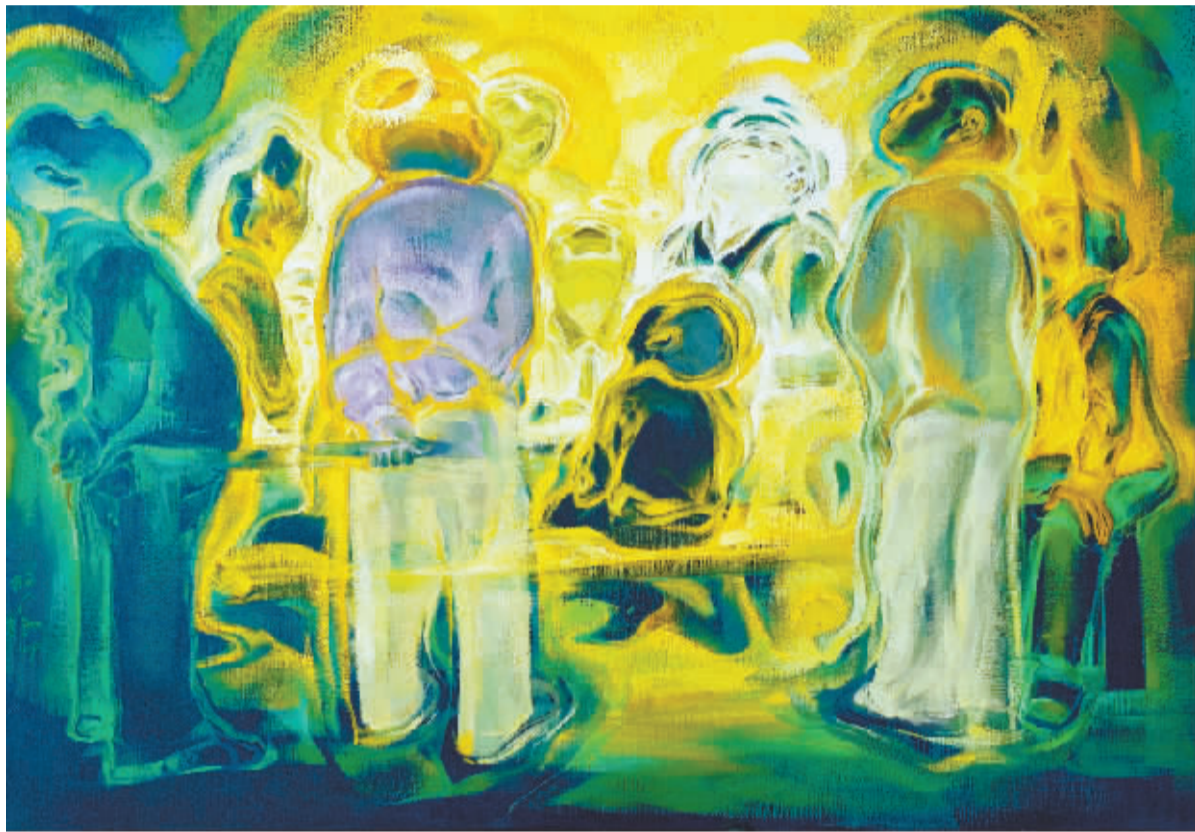
《谈天》62cm×112cm 油彩、画布 2009年

在阿卜极作品中的诸多元素之中,最重要的是一种笔触:一种源自东方狂草艺术的神秘线条。追根究底后你会发现,这种笔触其实是长期呼吸吐纳的结果,与鼓祭、太极、舞剑、经行、参禅、符篆书写等都十分类似。阿卜极显