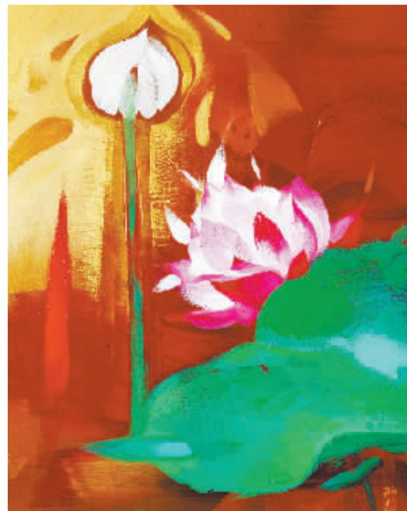
《采莲光华》(局部) 油彩、画布