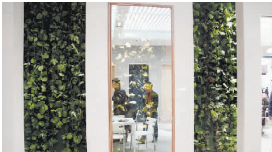
将门放在自然的空间里,与外界绿色相融,就增强了生命力。