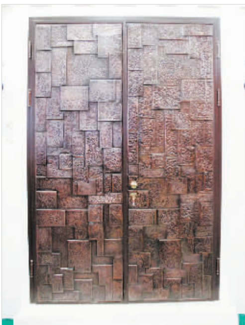
这款耶鲁的装甲门用钢铁铸造,厚实而古典,延伸了门的内涵。

打开一扇门,就是打开了一个世界,门里门外的精彩决然不同。在这个已能感受到春意的2月里,借助第十一届中国国际门业展览会这个华丽舞台,来找寻适合自己的那扇木门和那份感觉。或许是一个雕花设计打动了你;或许是一个创意的展台吸引了你;或许是一扇门散发的文化气息触动了你,你会发现,因为有了门,家会变得别样精彩。