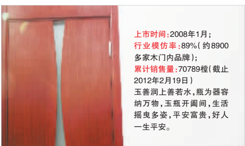
TATA在每一款门旁边写上历史与业绩,传达的是品牌与影响。