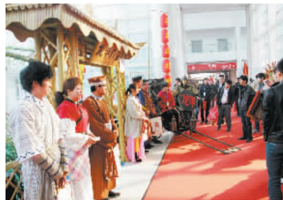
龙甲的展位不见一扇门,却洋溢着文化气息,成为人们拍照留影的好去处。

再比如TATA木门,展台清新爽洁,每一款门都以独有的创意传承着经典。“上市时间:2001年2月;行业模仿率:95%(约9500多家木门品牌,畅销款式中最早被模仿的);累计销售:838025个……”在白色为主色调的TATA木门展区里,这款白色格子木门旁边没有华丽的词藻描述产品之好,没有详细介绍产品材质和特色的说明书,