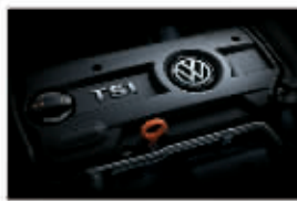
1.4TSI涡轮增压汽油直喷发动机