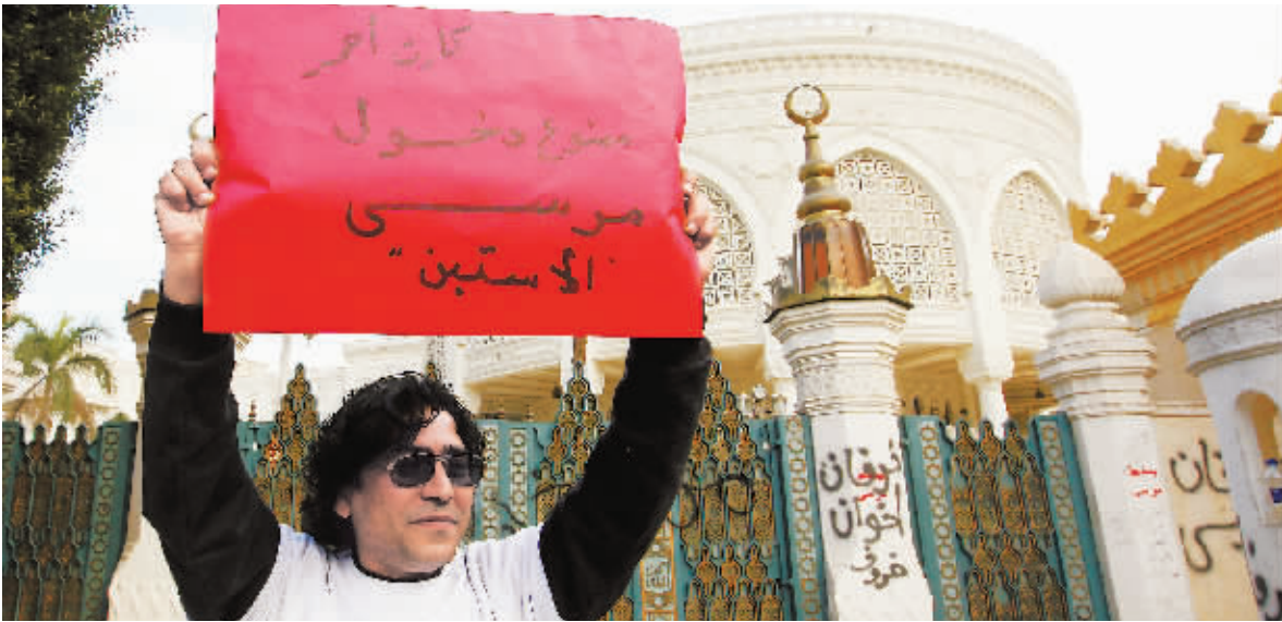
示威者持续抗议 埃及总统府爆发冲突

然而“无税不收”的美国在金融危机爆发后不愿再放弃可能流失在瑞士的巨额税款。2009年,美国政府掀起查税风暴,逼迫瑞士银行向美国松口,双方签署了一份可以绕过瑞士银行保密规定的查税协议,并先后向美国查证部门提供近5000份客户资料,协助美国政府海外追金。有分析说,“避税天堂”或将不再是富人资产的保险库。根据美国2010年3月18日生效的“海外账户纳税法案”有关规定,外国银行、基金管理公司、保险公司、对冲基金必须将美国公民账户信息交给美国税务机构,否则将被视为不与美国政府合作。若“不合作”的外国金融机构在美国有收入所得,美国将对其在美收入课以30%的惩罚性税收。 南报记者 王可 综合报道