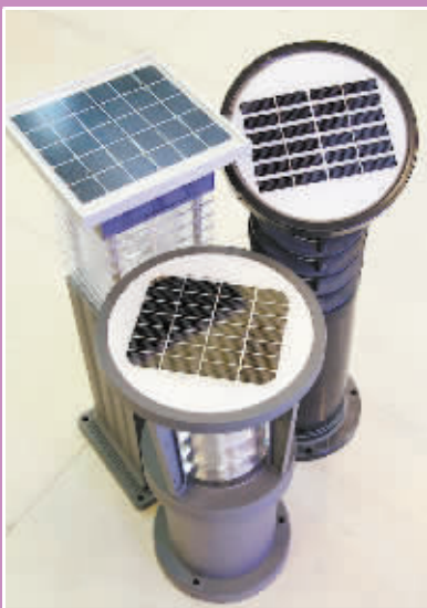
太阳能灯一年的节电量达到1万千瓦时

在万隆汇洋的卖场里,云集着很多新型的灯具产品,体现着“节能求亮”的流行潮。比如松下专卖店里,一款单管节能灯比双管日光灯还要亮,却能节省37%的用电量;在大荣灯具批发店里,一款信妥LED灯比传统平板灯省电80%,并以其超薄、多面发光的特色赢得了更为柔和的亮度;在天马照明专卖店里,还展示着各类太阳能灯,别看负责接收太阳能的只是一块小小的线路板,但它能将太阳能转化电能储存在蓄电池中,完全不需要额外接电源,达到了彻底省电的目的,在户外庭院里,装上几款这样的灯,夜间就真正亮了起来。