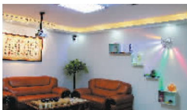
可通过遥控器控制的多变照明灯饰

秋天已经过去,冬天早已来临,居室里、街道上、庭院中、商场、宾馆……这些与人们生活息息相关的地方,依然是灯火璀璨,只不过,那些发光的灯饰,不经意间发生着变化,既有科技的创新,又有理念的突变,更有创意的呈现。12月1日,当万隆汇洋一年两度的流行趋势发布秋冬版正式揭开神秘面纱之时,人们发现,节能求亮、实用求美、特效求变这三大流行潮,正在秋冬的寒风中涌动,以不可阻挡之势袭向人们的生活空间,主宰着整个家居、商业、工程等不同领域的照明世界。