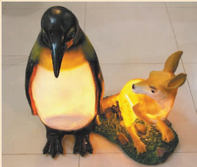
动物形态的户外灯实用而美观,更添一份自然魅力。