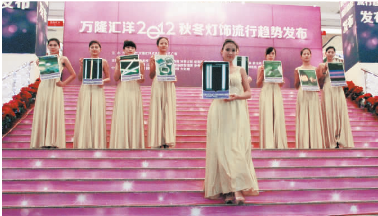
模特展示代表三大流行趋势的创意灯饰