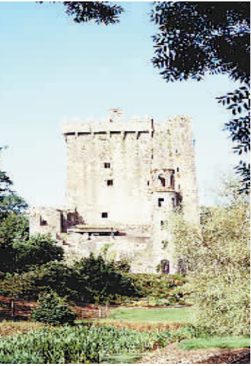
爱尔兰布拉尼城堡