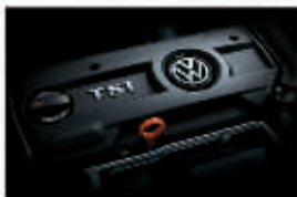
1.4TSI涡轮增压汽油直喷发动机