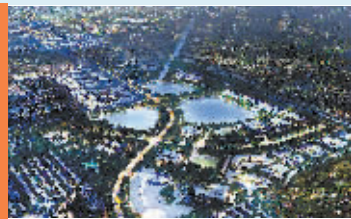
西山文化创意大道规划图