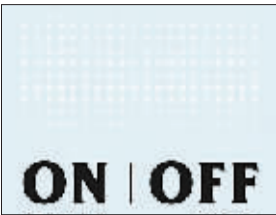
ON | OFF