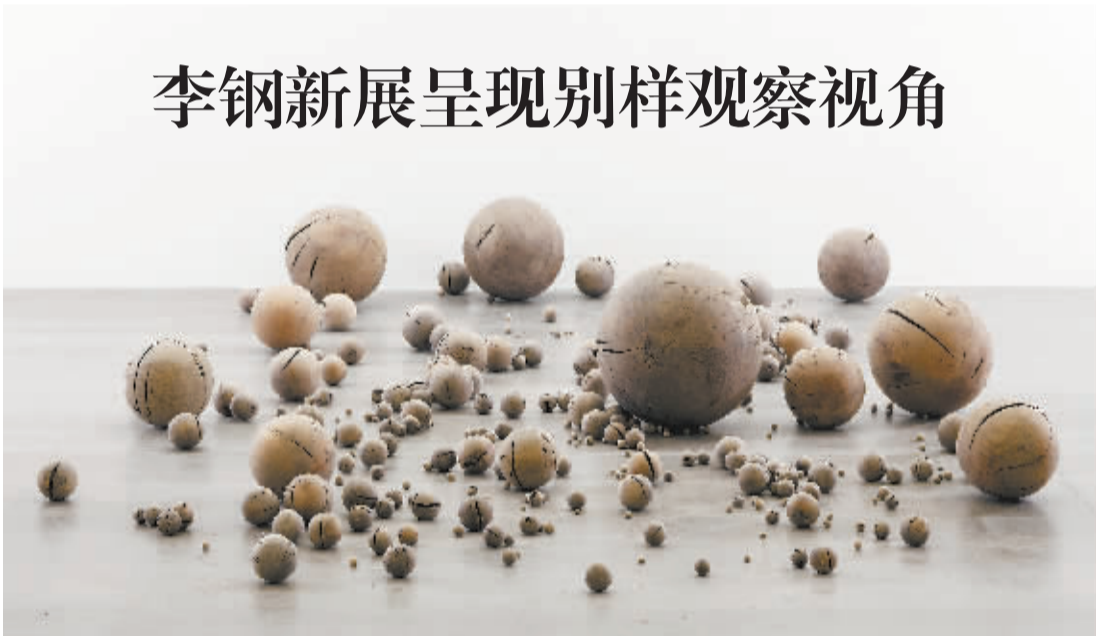
《念珠》木球 397件 直径0.5-51厘米不等 2012年

经过两年的探索,“青年艺术100”已经形成了全国巡展、专题展览、艺术家个展的展览形式。2013年,全国性的大规模巡展,依然是“青年艺术100”的重头戏,除了在北京、上海等艺术一线城市展览外,“青年艺术100”也将继续二三线城市的探索,继续在全国不同城市推广中国当代艺术。 据悉,本届“青年艺术100”报名截止日期为3月15日。