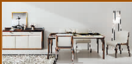
餐厅的桌子、椅子、边柜都将真皮与实木结合

在家具的众多材质中,真皮一直以细腻柔软的触感吊足了很多人的胃口,实木则以其硬汉躯体般的品质与线条征服了很多人的心。当两种材质结合在一起时,一种全新的家具新风尚就迎面而来。3月6日,天坛家具发布的“两厅系列”家具,就打破了“真皮”与“实木”的界限,融二为一,呈现出创新的无穷魅力。