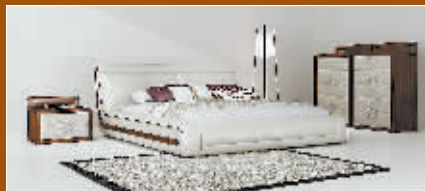
以实木做框架、以真皮做点缀的卧室家具