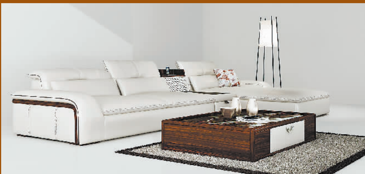
隐现的实木条纹增强了沙发的情趣,点缀的真皮抽屉打破了茶几的单调。

当“真皮”遇见“实木”,就像发生了奇妙的化学反应,无论是外观还是品质都体现出一种全新的感受。采用白色的真皮材料和棕色的实木材料结合的天坛家具“两厅系列”,给人第一眼的印象是层次中不显凌乱,简洁中不失雅致。