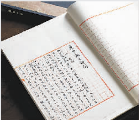
梁启超《袁世凯之解剖》

在刚刚结束的嘉德秋拍上,鲁迅一封致陶亢德的信拍出655.5万元,估计当年鲁迅写这封信的时候也想不到日后会有如此的场景出现。这并不是鲁迅的信札首次拍出高价。在今年5月的嘉德春拍中,一页鲁迅的《古小说钩沉》手稿,最初估价60万-65万元,最终以690万元的天价被藏家收入囊中。而同场拍卖会中,原为陈伯达旧藏的顾炎武书《五台山记》手稿以3162.5万元的天价成交。