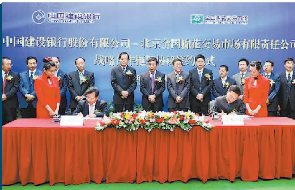
建行与全国棉花交易市场签署战略合作协议,建行针对该平台下棉花企业推出“e棉通”产品。

在电子商务和互联网金融蓬勃发展的今天,通过广阔的“网络世界”做生意的企业越来越多。对于这些有资金需求的企业来说,如果有一个全新的服务平台将网络银行金融服务与电子商务平台的网络信息、现金流、物流等相融合,从中能获得相应的融资服务,更是再好不过。建行就是嗅觉灵敏的商业银行之一,从2007年开始就不断创新推出“e贷款”系列产品,以满足电子商务平台交易客户的融资需求。