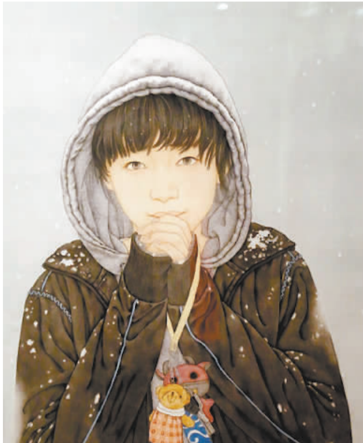
“中国梦·美丽中国”国画展部分作品