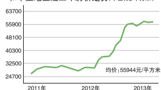
和平里地区近三年房价走势(单位:元/平方米)

解读:由于和平里地区汇集了一七一中学、和平里第一小学等多所中小学,这也让和平里地区滋生出大量“学区房”。在“学区房”的助长下,这里的房价节节攀升,从2011年到2013年,和平里地区房价增幅为44.69%,目前,均价为5.6万元。作为老旧小区,和平里地区房价居于北京城区前列。不过,人均收入与之并不匹配。2012年,和平里地区居民人均可支配收入为3.86万元,人均消费性支出为2.59万元。