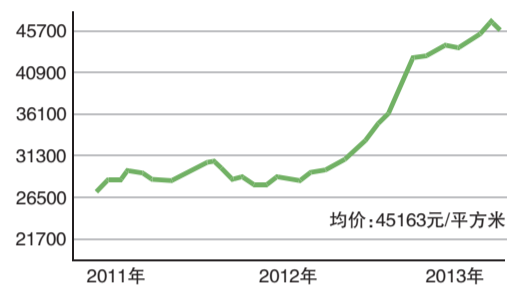
双井地区近三年房价走势图(单位:元/平方米)

解读: 作为“CBD的后花园”,双井地区已经成为成熟的商圈。绝佳的地理位置、众多大型商业项目以及便利的社区商业吸引了大量白领精英阶层在此购置物业,落户居住。同时,双井地区诸多楼盘为2002年以后新建,有些甚至是2008年左右的新小区。其中不乏面向高收入人群的高档楼盘,房价自然不菲。