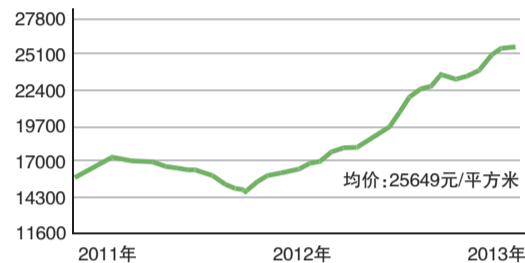
天通苑地区近三年房价走势图(单位:元/平方米)

解读:尽管天通苑在创立之初为北京市的经济适用房,但随着北京市房价的普遍上涨与外地人口的激增,原来的城乡接合部区域也迎来了房价的上涨。从数字中可以看出,如今的房价与十多年前初建时相比,已经达到了当时的十倍。