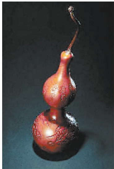
量力而行出手精品

对于葫芦的收藏而言,选择、购买、收藏的标准可能有很多,但是归根结底应该体现两个字:“喜欢”。这两个字有着双重含义,首先指的是对葫芦这一收藏门类的钟