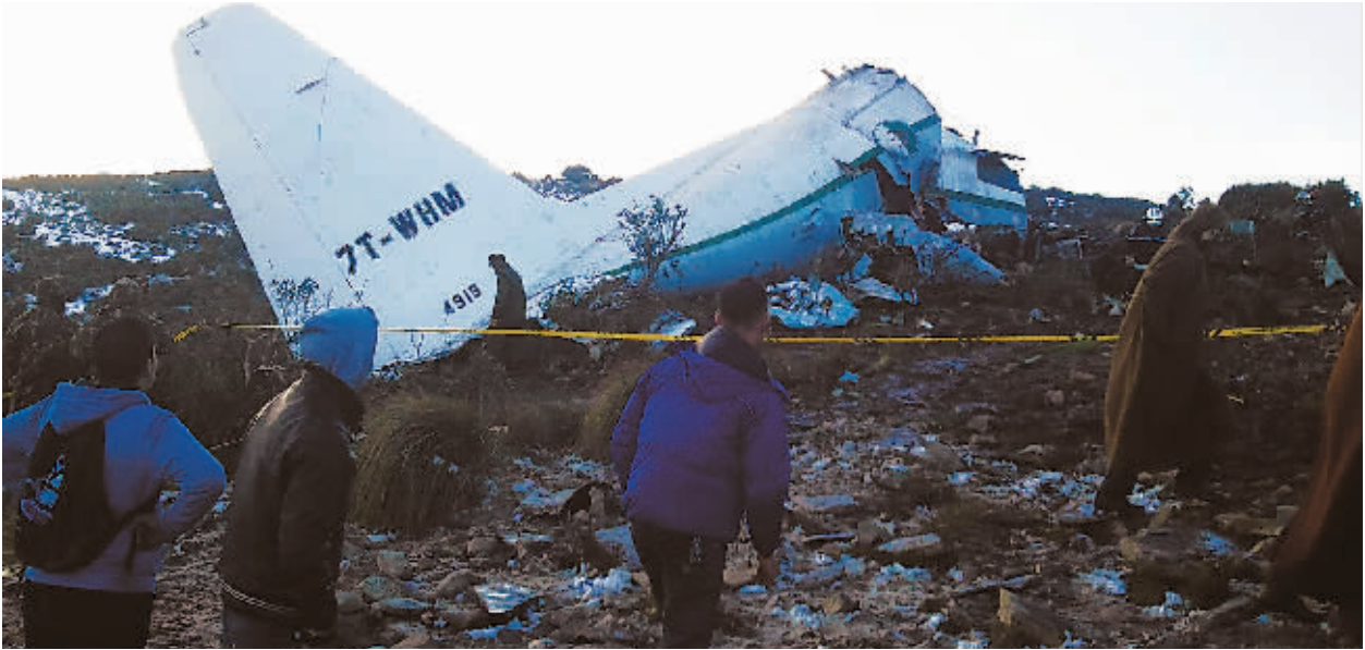
11日,阿尔及利亚发生一起军用飞机坠毁事故。阿军方发言人拉哈迈迪·布兰卡当日称,在阿东部乌姆布瓦吉省发生的军用运输机坠毁事故初步确认52人死亡。图为在事故现场拍摄到的军用飞机坠毁场面。