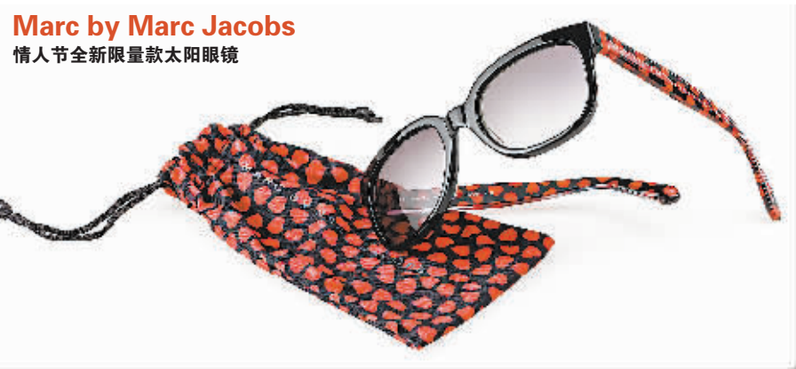
Marc by Marc Jacobs 情人节全新限量款太阳眼镜